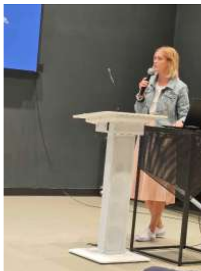
Obr. 62-63 – Seminár NitLib v knižnici SPU v Nitre

Od 11. septembra 2024 knižnica sprístupnila v novom vzhľade knižnú búdku a počas celého roka prebiehala zbierka starožitností do tradičnej ľudovej izby, ktorú plánujeme knižnica zriadiť v jednej zo svojich miestností, s cieľom obohatiť kultúrnu ponuku a uchovať miestne dedičstvo. Okrem toho knižnica v mesiacoch september-október realizovala prieskum spokojnosti medzi čitateľmi, aby lepšie porozumela ich potrebám a prispôsobila svoje služby na základe získaných informácií. Knižnica úzko spolupracuje s miestnou základnou a materskou školou, Centrom voľného času Slniečko a s Materským centrom Blšky, kde raz do týždňa realizuje čítanie pre najmenších, čím podporuje rozvoj čitateľských návykov u detí už od útleho veku.