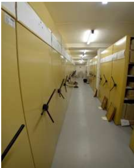
Obr. 18 – Odovzdanie matrik do archívu