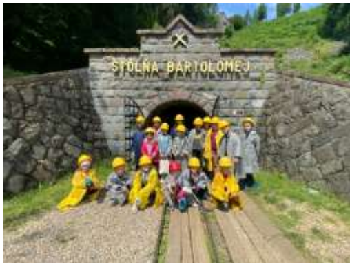
Obr. 78 – Letný tábor