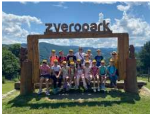
Obr. 79– Letný tábor

V septembri 2024 sa zúčastnili mladí futbalisti turnaja futbalových nádejí MAS VITIS , ktorý sa koná každý rok v inej obci. V tomto roku bol turnaj v obci Horná Kráľová. Deti boli úspešné a vybojovali krásne 2. miesto.