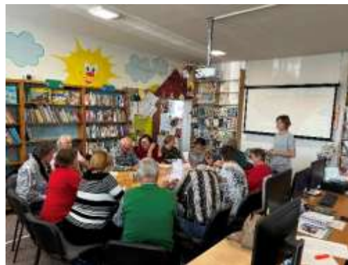
Obr. 55 – Tréning pamäti pre seniorov