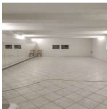
Obr. 81-82 – Zrkadlová miestnosť pred prerábkou a po prerábke