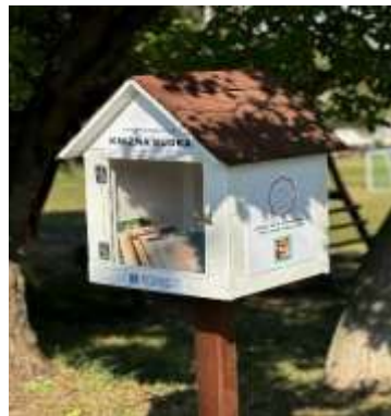
Obr. 65 – Knižná búdka na ihrisku za ZŠ

Knižnica plánuje ďalej zvyšovať kvalitu svojich služieb, rozširovať programy pre deti, dospelých aj seniorov a pokračovať v inováciách, ktoré prinesú novú dimenziu do života miestnej komunity. S cieľom neustále reagovať na potreby obyvateľov a podporovať kultúrny a vzdelávací rozvoj obce, sa knižnica stane ešte dynamickejším centrom pre všetkých, ktorí túžia po nových vedomostiach, zábave a inšpirácii.