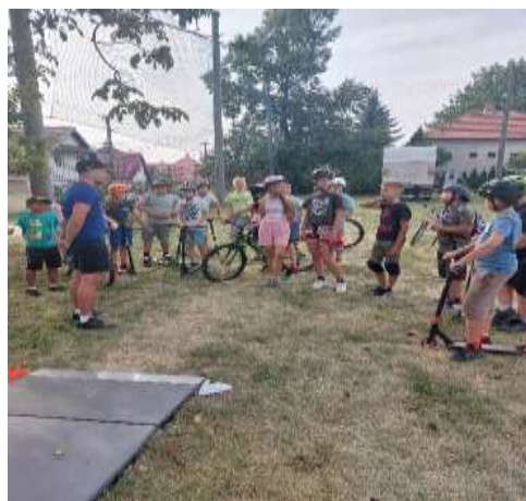
Obr. 42 – účelové cvičenie