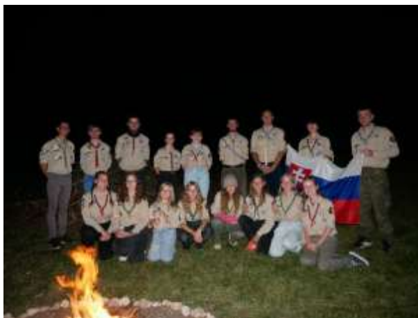
Obr. 104 – Letný tábor skautov

Okrem toho sa táto akcia niesla v znamení spomienok na letný tábor, ktorý sa tento rok opäť konal na overenom táborisku v nádhernom prostredí Veľkej Fatry. Povzbudení zdieľanými zážitkami odhodlane vykročili do nového skautského roka, ktorý bude opäť plný aktivít. Čaká ich pravidelné stretávanie sa malých skupín na týždennej báze, ale aj veľké akcie, ako sú Skautské Vianoce, roznášanie Betlehemskeho svetla či letný tábor, kde sa opäť zídu vo väčšom počte.