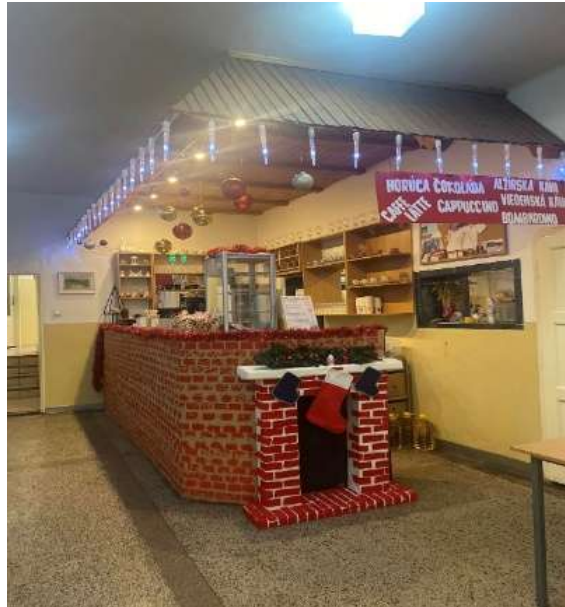
Obr. 83 – Vianočné trhy

V decembri 2024 v spolupráci s obecným úradom sa zorganizoval vianočný jarmok a Mikuláš. Pre deti centrum voľného času pripravilo mikulášske balíky, zabezpečovali predajné stánky na trhy a občerstvenie pre obyvateľov obce.