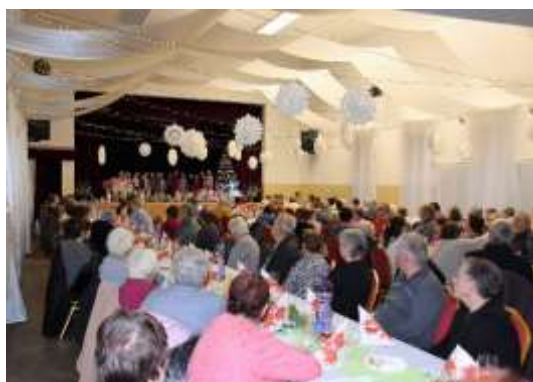
Obr. 110-111 – Rozlúčka so starým rokom