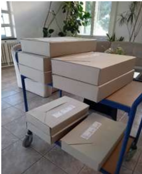
Obr. 16 – Odovzdanie matrik do archívu

dôkladne uložili do archívnych krabíc, označili a spisali zoznam odovzdaných kníh. Takto označené ich prevzala vedúca oddelenia služieb verejnosti. Pracovníčky archívu nám ukázali ako budú uložené v miestnosti pri konštantnej teplote a vlhkosti vzduchu. Na našom matričnom úrade sú uložené knihy narodení, knihy manželstiev a knihy úmrtí od roku 1923 do roku 1949 aj pre obce Jarok a Lehota, od roku 1950 až po súčasnosť už iba pre obec Veľké Zálužie.