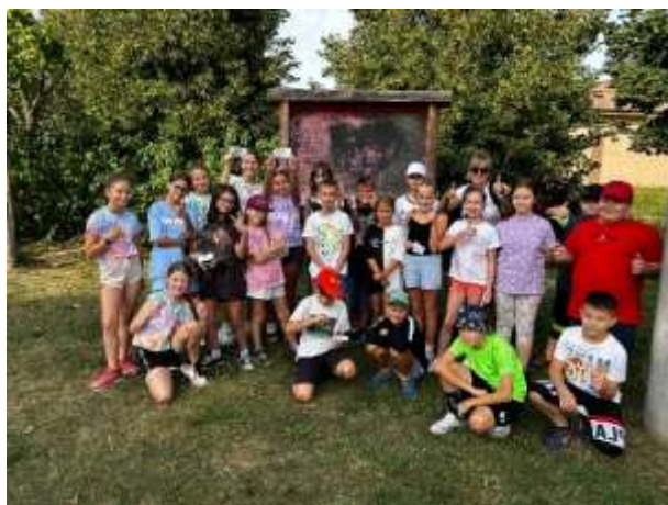
Obr. 41 – účelové cvičenie

Toto cvičenie sa konalo 5. a 6. septembra 2024. Prvý deň bol venovaný teoretickým témam ako civilná ochrana, zdravotná príprava a pohyb v prírode. Druhý deň sa žiaci zapojili do praktických úloh, vrátane orientácie v teréne pomocou mapy, hľadania pokladu, opakovania dopravných výchovy a využitia pumptrackovej dráhy.