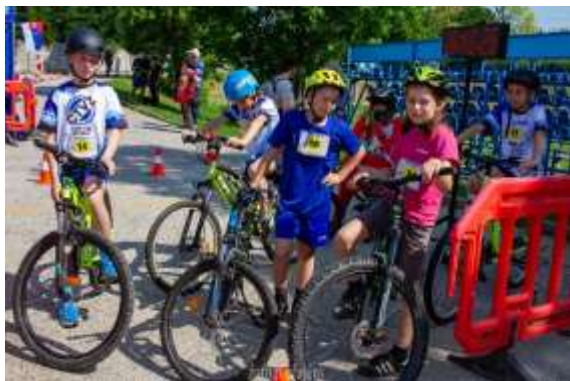
Obr. 133 – 1. ročník Duathlonu

V máji klub pokračoval 1. ročníkom Duathlonu Veľké Zálužie 2024. Po minuloročnom úspešnom 0. ročníku sa rozhodli pretvoriť toto podujatie na tradíciu a priniest' do našej obce novú možnosť súťažnej športovej aktivity. Okruhy pre beh detí sa konali na novej bežeckej dráhe, pre dospelých po obvode ihriska a okruhy pre bicykle boli v rámci areálu. Preteku sa zúčastnilo 92 pretekárov, prevažne detí.