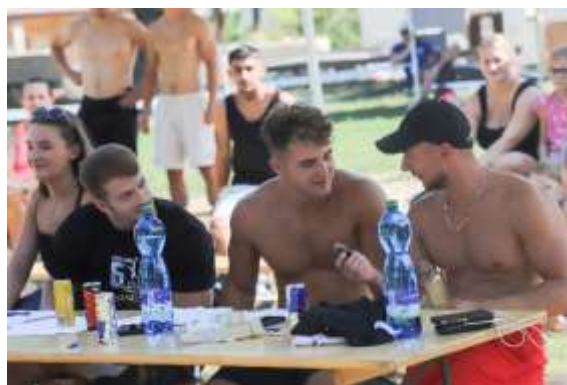
Obr. 141 – Ulacký pohár – porota