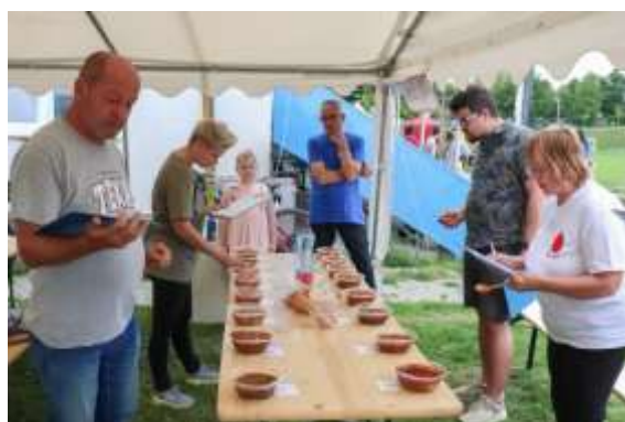
Obr. 99 – Hodnotenie najlepšieho guláša