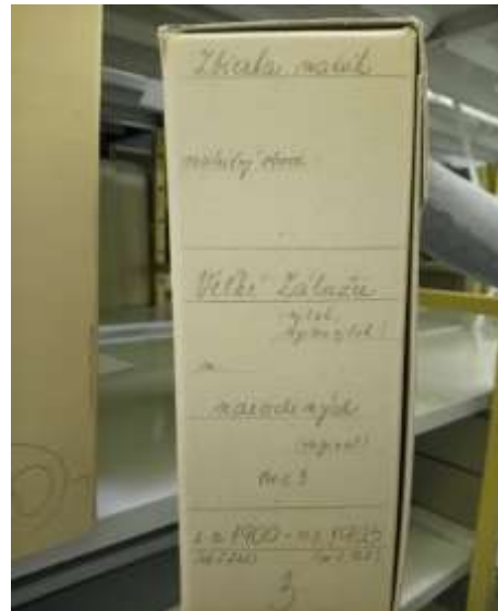
Obr. 17 – Odovzdanie matrik do archívu