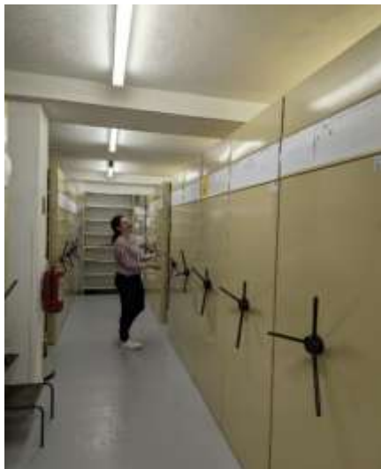
Obr. 20 – Odovzdanie matrík do archívu