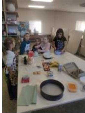
Obr. 69 - Cukrár, pekár