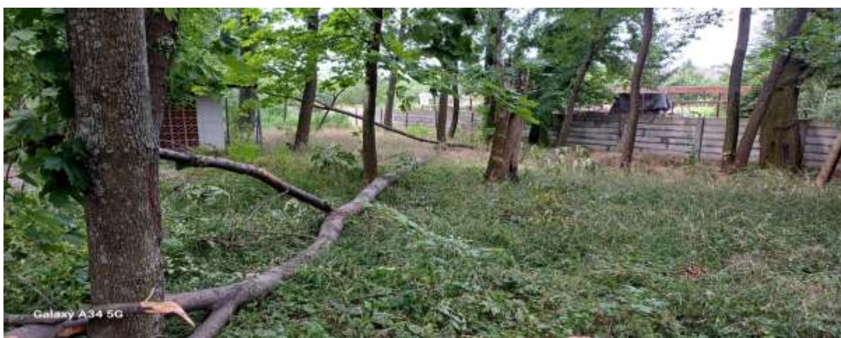
Obr. 25 – Padajúce korene a kmene