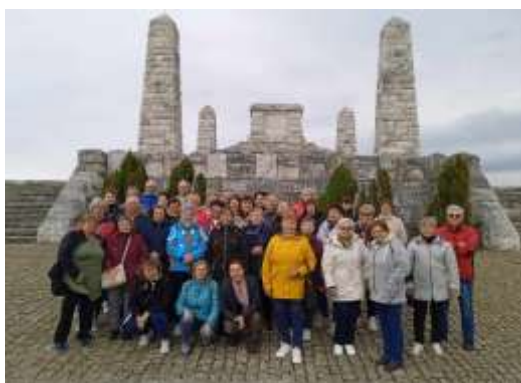
Obr. 112 - Výlet Bradlo