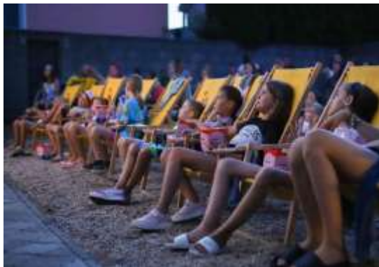
Obr. 60 – Večerné kino