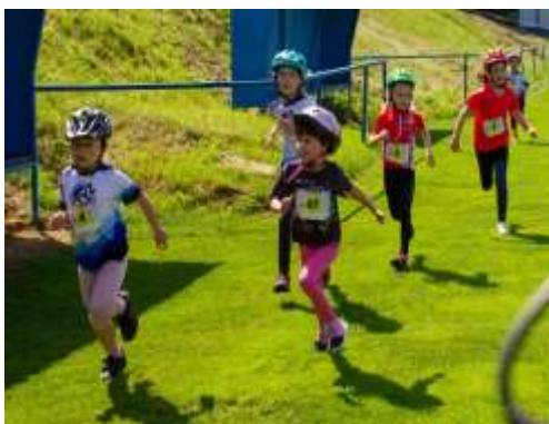
Obr. 135 – 1. ročník Duathlonu