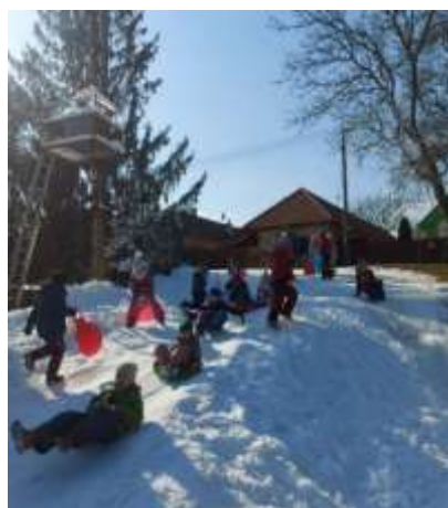
Obr. 49 – Deti zo školského klubu 5