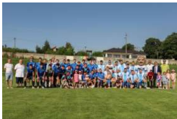
Obr. 129 – Športový klub Veľké Záluží