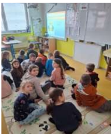
Obr. 48 – Deti zo školského klubu