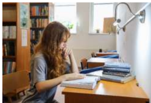
Obr. 53 – Priestory knižnice