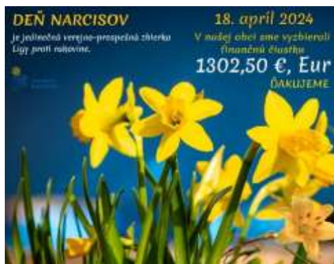
Obr. 123 – Poďakovanie miestnemu spolku