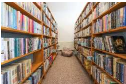
Obr. 52 – Priestory knižnice

Rok 2024 bol pre knižnicu kľúčovým a mimoriadne úspešným obdobím, a to najmä vďaka podpore z Fondu na podporu umenia. Tieto finančné prostriedky umožnili knižnici významne rozšíriť svoju knižnú ponuku a zlepšiť služby, čím sa stala ešte prístupnejšou a atraktívnejšou pre čitateľov.