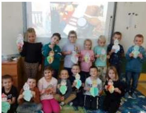
Obr. 46 – Deti zo školského klubu