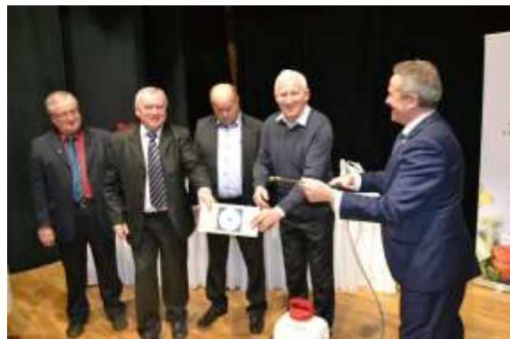
Obr. 115 - Krst CD – záhradkárská pieseň