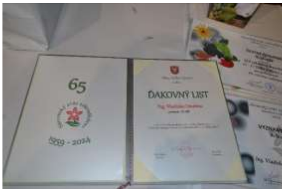
Obr. 114 - Ďakovný list predsedovi ZO SZZ