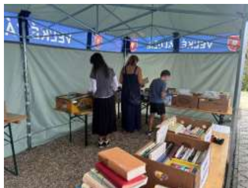
Obr. 57 – Burza vyradených kníh