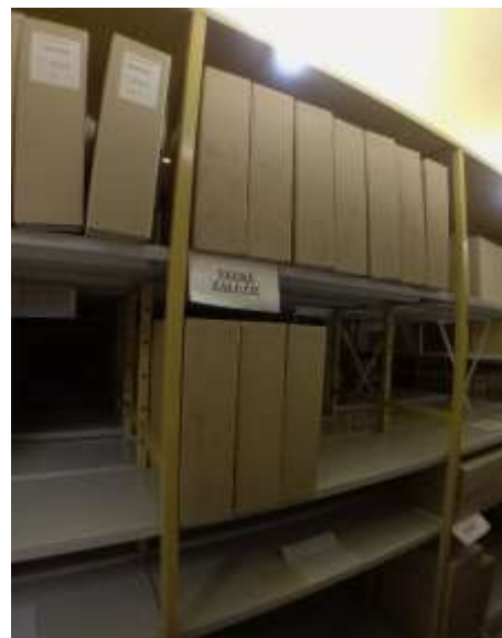
Obr. 19 – Odovzdanie matrik do archívu