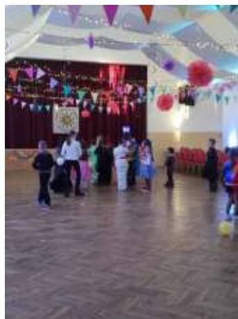
Obr. 72 – Karneval

Dňa 29. januára 2024 zorganizoval o centrum pre krúžkové deti karneval. V toto popoludnie sa stretlo v Spoločenskom dome veľké množstvo masiek, ktoré sa spolu zabávali a súťažili. Rodičia boli nápomocní v zabezpečení občerstvenia.