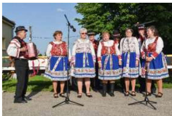
Obr. 94 – Folklorná skupina UJLAČANKA