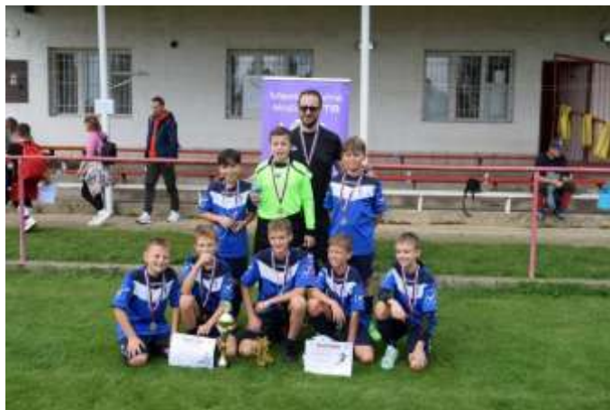
Obr. 80 – futbalový turnaj

V septembri 2024 sa zúčastnili mladí futbalisti turnaja futbalových nádejí MAS VITIS , ktorý sa koná každý rok v inej obci. V tomto roku bol turnaj v obci Horná Kráľová. Deti boli úspešné a vybojovali krásne 2. miesto.