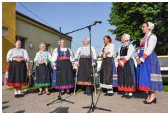
Obr. 93 – Folklorná skupina Drienka