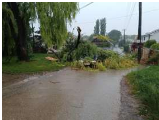
Obr. 22 – Dolámané stromy na ulici Malináreň

V roku 2024 nebola v obci vyhlásená mimoriadna situácia spôsobená privalovými dažďami a zosuvom pôdy z okolitých poľnohospodárskych plôch, ktoré boli častejšie v predošlých rokoch. Dňa 27. júna 2024, následkom silného dažďa a silného vetra, bolo dolámaných viacero stromov v častiach obce, ktoré spôsobili aj škody na majetku, ale neboli v takom rozsahu, aby bol vyhlásený mimoriadny stav. Pri odstraňovaní zasahovali členovia DHZ Veľké Zálužie a pracovníci obce. Následne boli niektoré stromy, ktoré by mohli spôsobiť ujmu na majetku opílené, aby sa predišlo takýmto škodám.