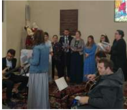
Obr. 128 – Zbor Valaquentá