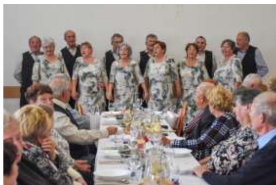
Obr. 107 – Folklorná skupina UJLAČANKA

reprezentovali obec piesňami a krojmi. Okrem pozvania v Nitrianskom kraji dostali aj pozvanie zo Stredoslovenského a Východoslovenského kraja.