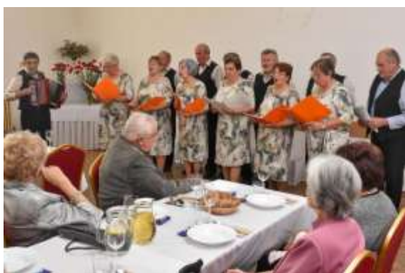
Obr. 12 – Folklorná skupina UJLAČANKA