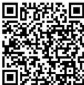
Obr. 139 – Ročenka CTVZ