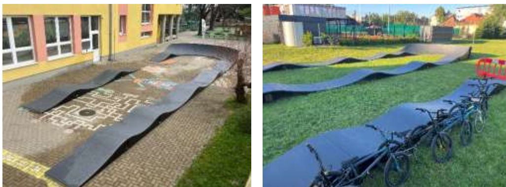
Obr. 136-137 – Modulárna dráha

S touto aktivitou plánuje klub pokračovať aj v budúcnosti, aby mohli ďalej podporovať deti v aktívnom životnom štýle.