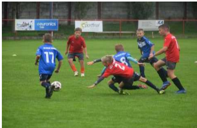
Obr. 44 – futbalový turnaj