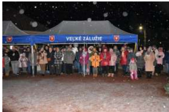
Obr. 102-103 – Požehnanie adventného venca