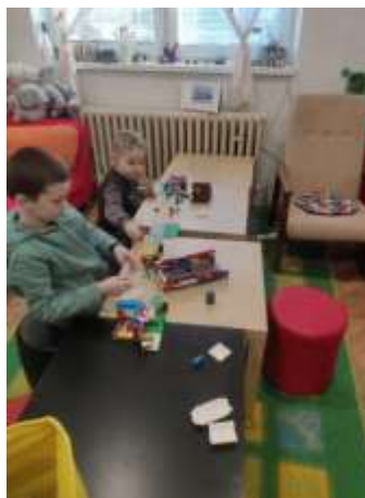
Obr. 67 – Animátor