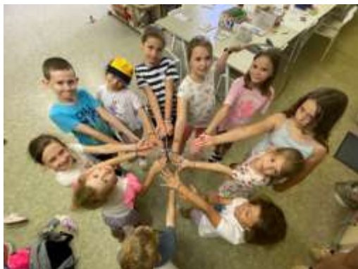
Obr. 76 – Letný tábor

Od začiatku roka 2024 centrum voľného času pripravuje do obecného časopisu rubriku pre deti, ktorú nazvali Slniečkovo . Je to dvojstrana plná krížoviek, doplnovačiek, vtipov, tipov na kreslenie a tvorenie s deťmi.