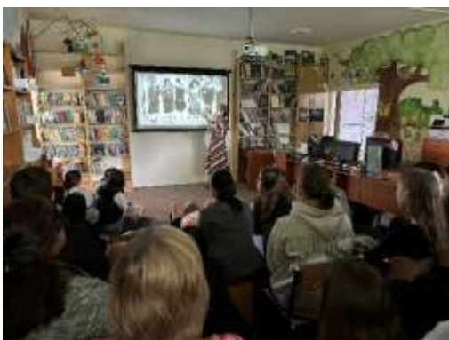
Obr. 56 – Beseda pre II. stupeň ZŠ