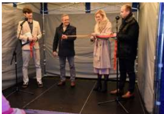
Obr. 50 – Znovuo tvorenie knižnice

Obecná knižnica vo Veľkom Záluží, ktorá bola slávnostne znovuo tvorená 13. novembra 2023 v nových priestoroch a so zmeneným personálnym zložením, sa stala živým centrom kultúry, vzdelávania a komunitného života.