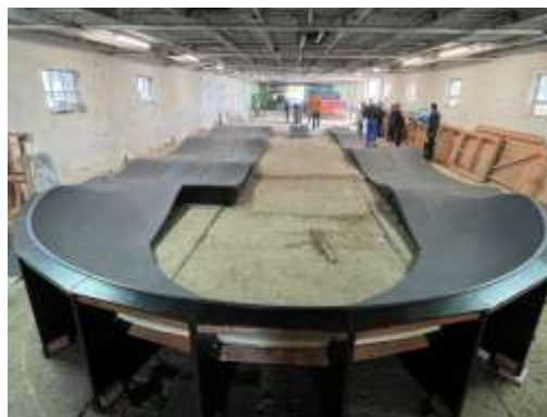
Obr. 131 – Halový tréning