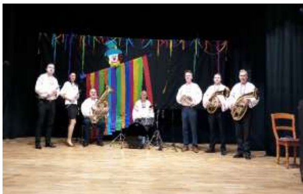
Obr. 108 – Pochovávanie basy

Ako je zvykom v každej obci, tak aj vo Veľkom Záluží sa konal fašiangový sprievod spojený s pochovávaním basy. Túto tradíciu dychová hudba ZÁLUŽANKA približuje mladšej generácii v spolupráci s folklórnou skupinou UJLAČANKA. Po fašiangovej veselici nastáva obdobie pôstu a teda aj pôstu od hudby. Je to čas, kedy kapela nacvičuje skladby pre ďalšie rôzne príležitosti. Dychová skupina ZÁLUŽANKA odohrala svoj repertoár aj na Petropavlovskom jarmoku, či Zálužskom vinobraní a Požehnaní mladých vín.