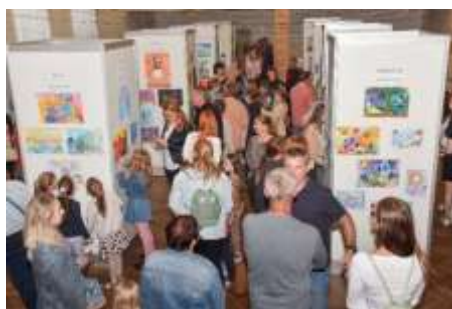
Obr. 74-75 – Zálužská paleta