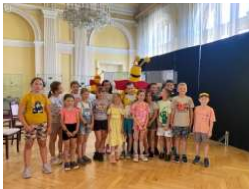
Obr. 77 – Letný tábor