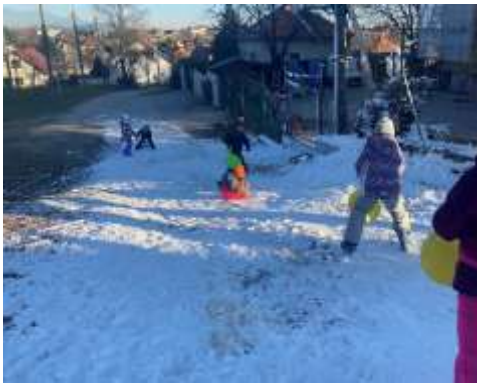
Obr. 70 - Malý športovec