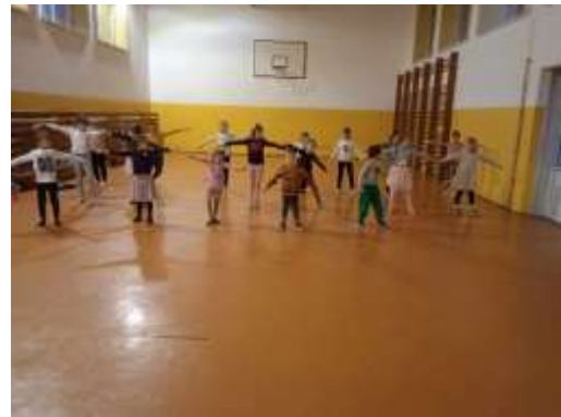
Obr. 71 - Minidisco

Dňa 29. januára 2024 zorganizoval o centrum pre krúžkové deti karneval. V toto popoludnie sa stretlo v Spoločenskom dome veľké množstvo masiek, ktoré sa spolu zabávali a súťažili. Rodičia boli nápomocní v zabezpečení občerstvenia.