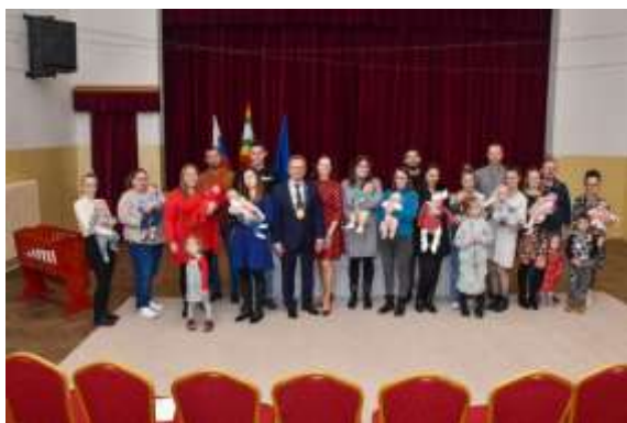
Obr. 6 – Uvítanie detí v obci – november 2024