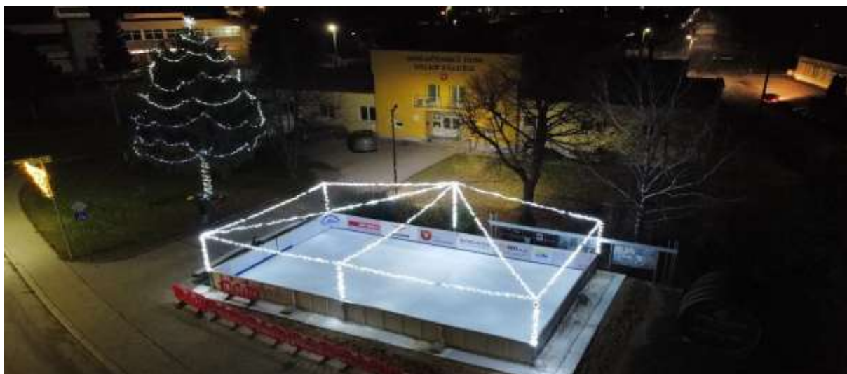
Obr. 27 – Využitie výrubu na vianočný stromček

Jednou z pozoruhodných udalostí bolo využitie jedného z vyrúbaných stromov na obecný vianočný stromček. Tento krásny strom sa počas sviatočného obdobia stal dominantou námestia a priniesol do obce atmosféru pokoja a radosti, ktorá spojila miestnych obyvateľov pri rôznych kultúrnych a spoločenských podujatiach.