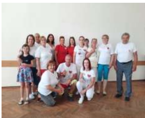
Obr. 122 - Letná kvapka krvi