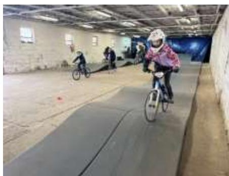
Obr. 132 – Halový tréning