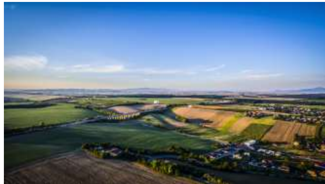
Obr. 3 – Kopcovitá dedinka Veľké Zálužie – vhodné podmienky pre rozvoj poľnohospodárstva a vinohradníctva

vlastných rodín, ale aj k zachovaniu dedičstva predkov, ktoré zostáva zapísané v každom kúsku obrábanej zeme.