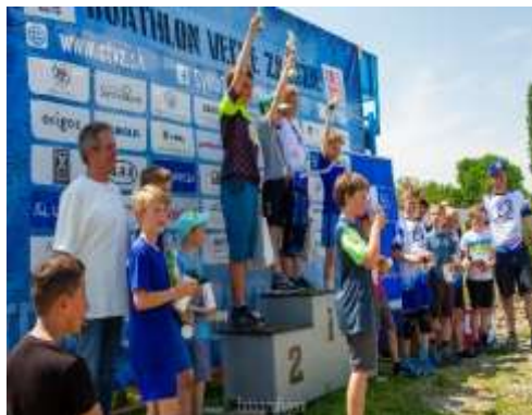
Obr. 134 – 1. ročník Duathlonu