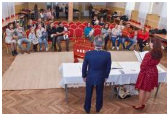
Obr. 7 – Uvítanie detí v obci – november 2024