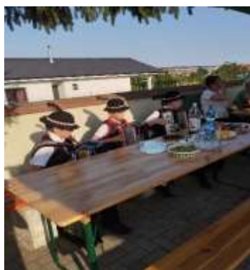
Obr. 113 - Opekačka JDS