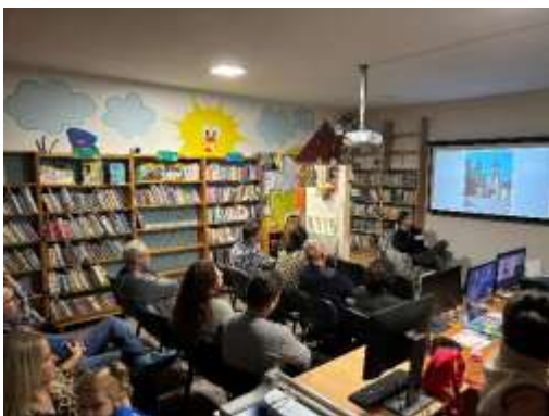
Obr. 58 – Cestovateľská beseda