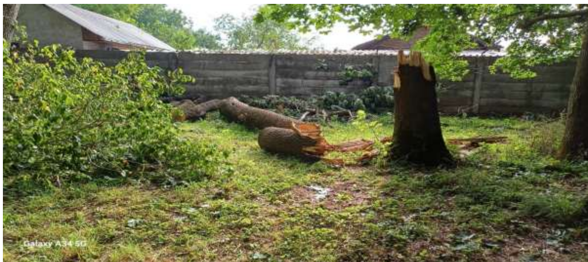
Obr. 26 – Padajúce korene a kmene

Jednou z pozoruhodných udalostí bolo využitie jedného z vyrúbaných stromov na obecný vianočný stromček. Tento krásny strom sa počas sviatočného obdobia stal dominantou námestia a priniesol do obce atmosféru pokoja a radosti, ktorá spojila miestnych obyvateľov pri rôznych kultúrnych a spoločenských podujatiach.