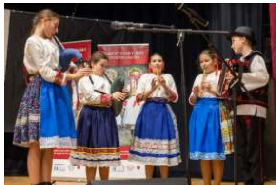
Obr. 125 – Folklorná skupina Drienočka