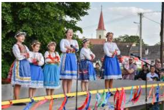
Obr. 92 – Folklorná skupina Drienočka