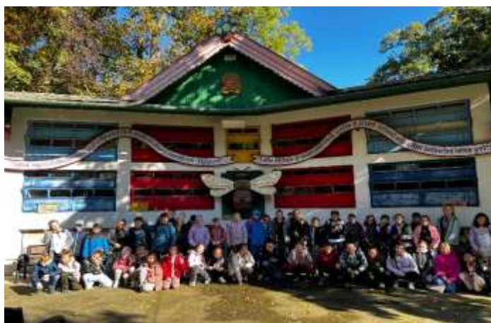
Obr. 45 – exkurzia žiakov

Žiaci sa zúčastnili exkurzie vo včelárskej paseke. Deti sa dozvedeli množstvo zaujímavých informácií o včelách, ochutnali rôzne druhy medu a na záver si zaspievali so sprievodom gitary.