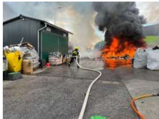
Obr. 106 - Výjazd k spadnutému stromu na mot. vozidlo