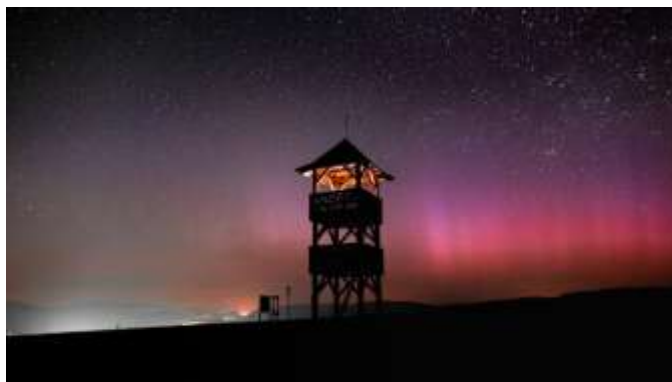
Obr. 145 – Polárna žiara

Od piatka 10. mája 2024 po dobu pravdepodobne 3 dní bola v nočných hodinách nad Slovenskom viditeľná polárna žiara. Išlo o doteraz najsilnejšiu žiaru v našich končinách viditeľnú voľným okom. Nadšenci astronómie a prírodných javov verili, že bude bezoblačné počasie a nič im tak neprekazí tento jedinečný a fascinujúci zážitok v podobe tzv. vesmírneho divadla.