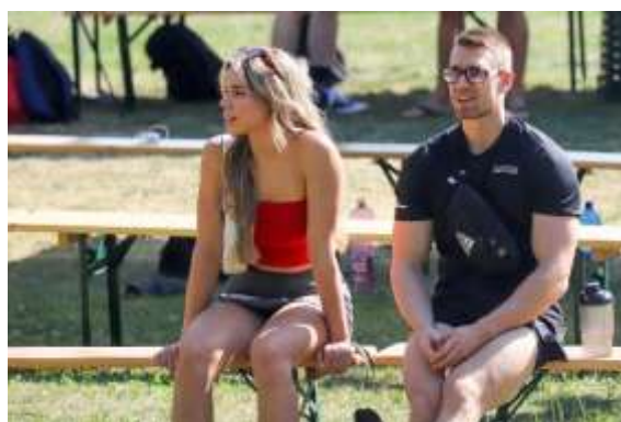
Obr. 143 - Martin Slezák – vicemajster sveta v naturálnej kulturistike