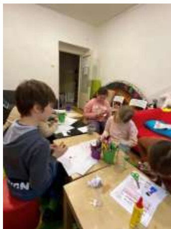
Obr. 66 – Hravá angličtina

Záujmové krúžky v rámci centra voľného času sú z rôznych oblastí športu, umenia, jazykov, spoločensko-vednej oblasti a pracovno-technickej oblasti: