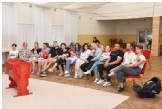
Obr. 5 – Uvítanie detí v obci – máj 2024