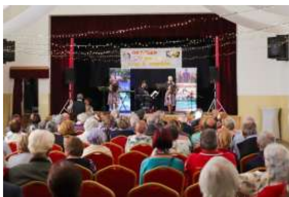
Obr. 13 – Skupina HELIGONICA