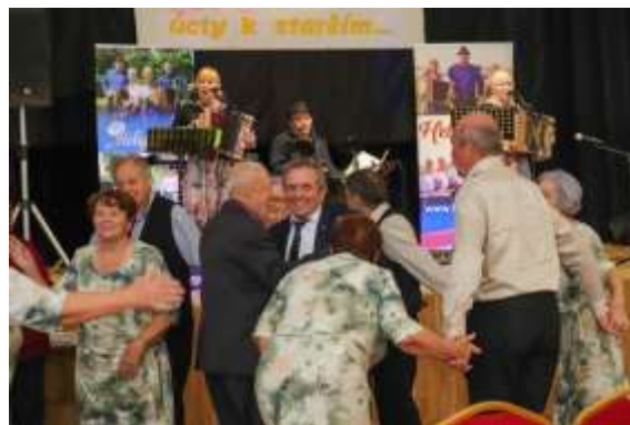
Obr. 15 – Zábava počas posedenia jubilantov