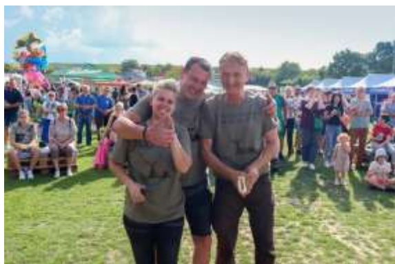
Obr. 95 - 1. miesto Lovecký spolok Veľké Zálužie

Počasiе bolo slnečné, no v diaľke sa blížil mrak, ktorý mal namierené rovno k nám. Bodku za oslavou Medzinárodného dňa detí urobil UJO ĽUBO a jeho cukríkový dažď. A veru, keď dopadli posledné „dažďové cukríky“ na zem, začali padať naozajstné dažďové kvapky. Čierny mrak dlho nezostal visieť nad areálom športového klubu a tak sa mohlo pokračovať v zábave pri hudbe DJ Martina Molnára. Oslavná atmosféra sa niesla areálom do 22:00 hod., kedy sa zatvorili predajné stánky a návštevníci pomaly opúšťali priestor športového klubu.