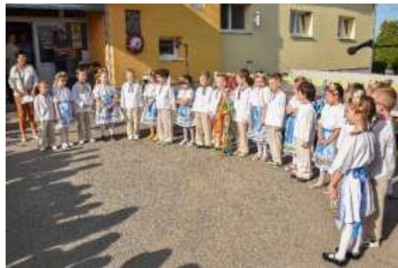
Obr. 91 – Vystúpenie detí z materskej školy