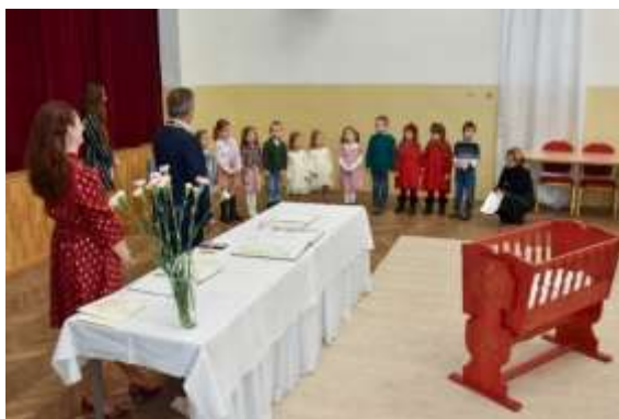
Obr. 28 – Vystúpenie detí – uvítanie novorodencov do života