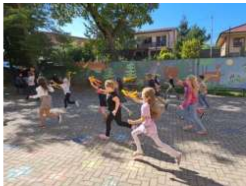
Obr. 47 – Deti zo školského klubu