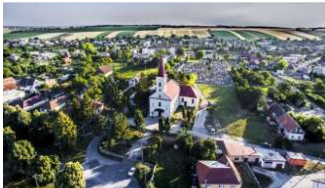
Obr. 2 – Kostol vo Veľkom Záluží a blízke okolie