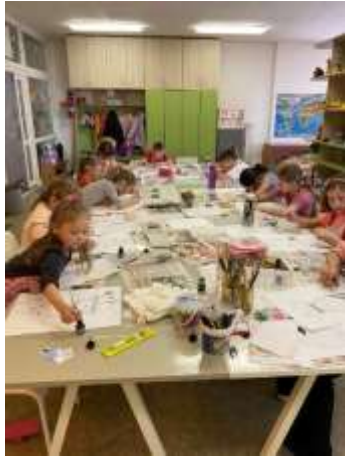
Obr. 68 - Šikovné ručičky