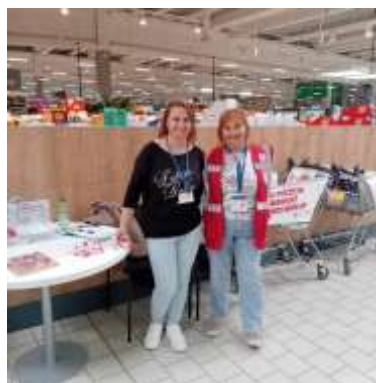
Obr. 121 - Pomáhame s potravinami