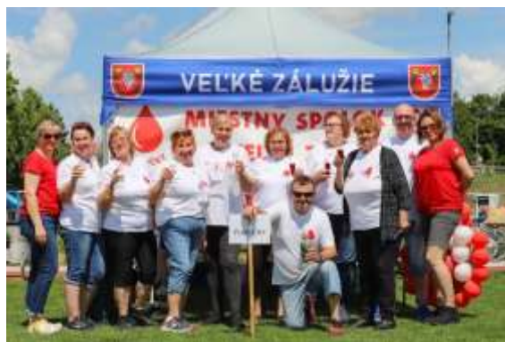
Obr. 98 - Tím Pijavičky