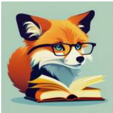
Obr. 64 – Logo knižnice