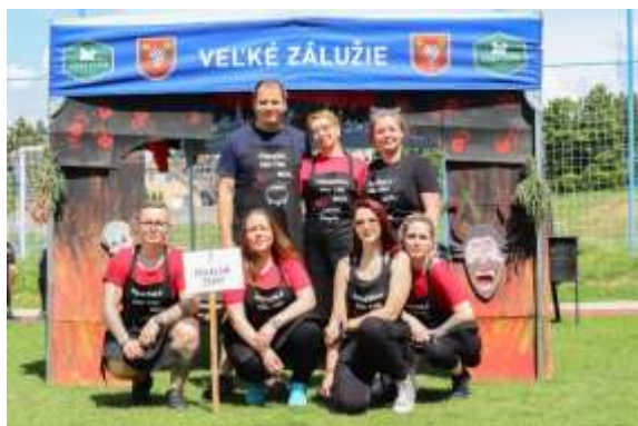
Obr. 97 - Tím Pekelné ženy