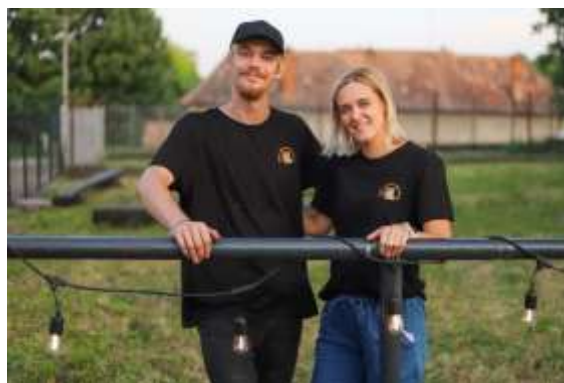
Obr. 51 – Vedenie knižnice

Rok 2024 bol pre knižnicu kľúčovým a mimoriadne úspešným obdobím, a to najmä vďaka podpore z Fondu na podporu umenia. Tieto finančné prostriedky umožnili knižnici významne rozšíriť svoju knižnú ponuku a zlepšiť služby, čím sa stala ešte prístupnejšou a atraktívnejšou pre čitateľov.