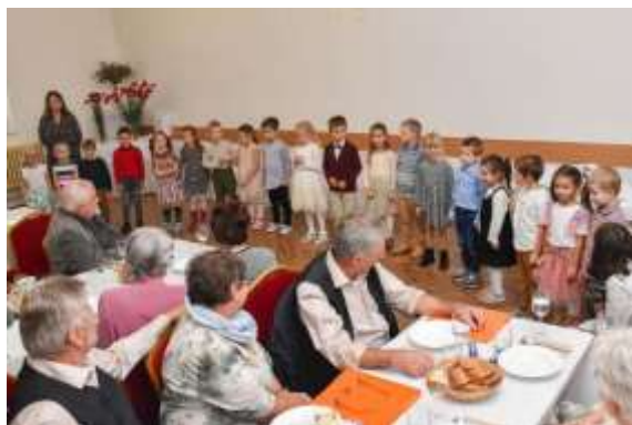
Obr. 14 – Vystúpenie detí z MŠ vo Veľkom Záluží