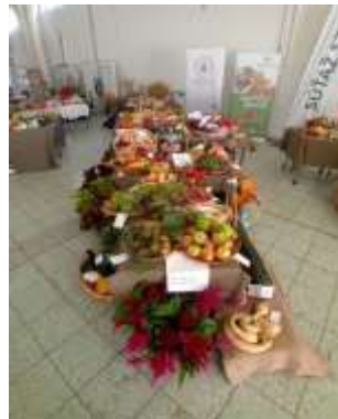
Obr. 117 - Výstava Agrokomplex