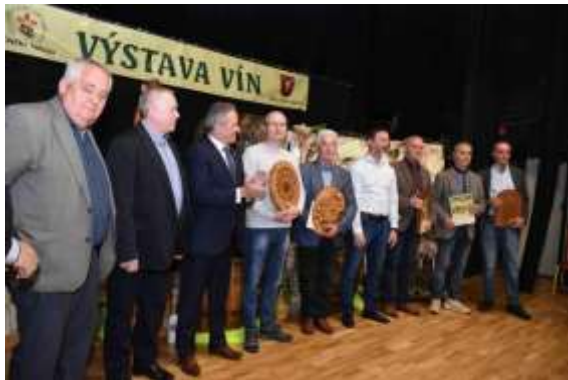
Obr. 116 - Verejná degustácia vín