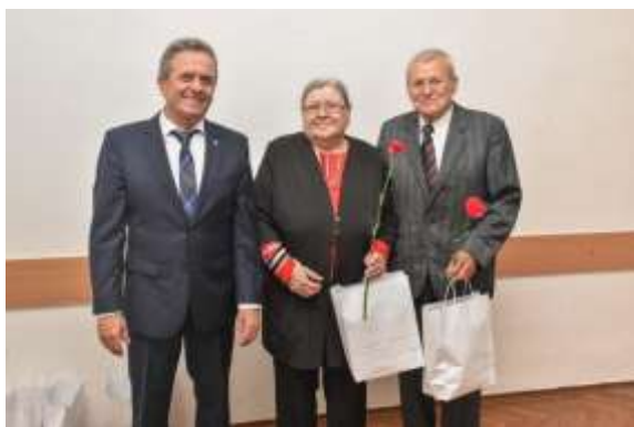
Obr. 10 – 60 rokov spolu