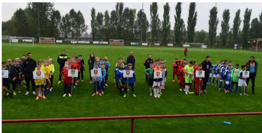
Obr. 43 – futbalový turnaj

Dňa 25. septembra 2024 sa žiaci zúčastnili turnaja v obci Horná Kráľ'ová, organizovaného MAS VITIS v spolupráci s miestnou samosprávou. 4