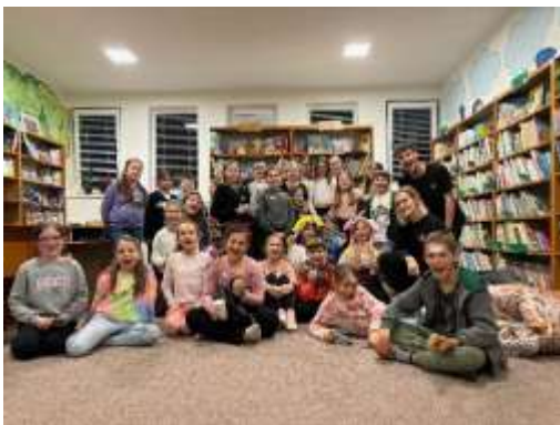
Obr. 54 – Noc s Andersenom