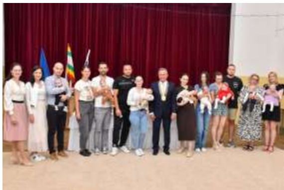
Obr. 4 – Uvítanie detí v obci – máj 2024

K 31. decembru 2024 malo Veľké Zálužie 4352 obyvateľov. Z toho bolo 2120 mužov a 2232 žien. Priemerný vek obyvateľstva v obci bol 41,74 roka.