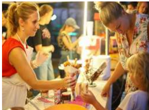
Obr. 61 – Večerné kino – občerstvenie

Obecná knižnica vo Veľkom Záluží sa 10. septembra 2024 zúčastnila seminára NitLib 2024, kde so svojou vlastnou prezentáciou úspešne predstavila svoje aktivity. Knižnica si vyslúžila veľkú pochvalu a v porovnaní s ostatnými knižnicami v Nitrianskom kraji dosiahla vynikajúce výsledky.