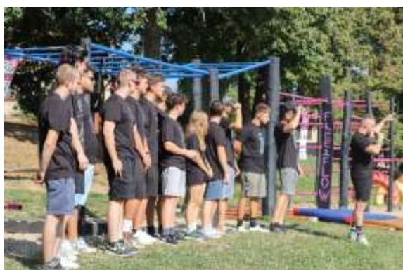
Obr. 142 - Street Workout Veľké Zálužie