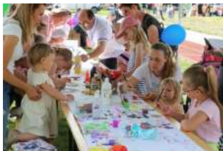
Obr. 118 – Míľa pre mamu