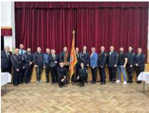
Obr. 105 - Výročná členská schôdza hasičov

Počas zimy sa naďalej venovali našim mladým hasičom a trénovali ich v telocvični základnej školy každý piatok v týždni. Celoročne prijímajú do zboru deti od 6 rokov, dievčatá aj chlapcov. Za tréningy sa neplatilo, účasť v zbere bola dobrovoľná.