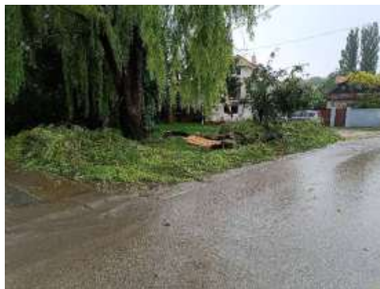
Obr. 23 – Dolámané stromy na ulici Malináreň