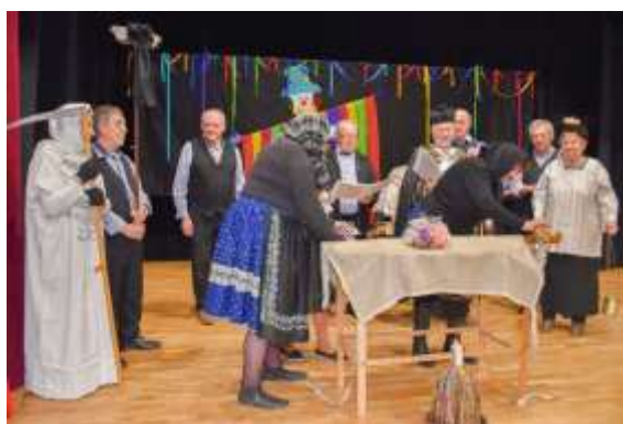
Obr. 84-89 – Fašiangy