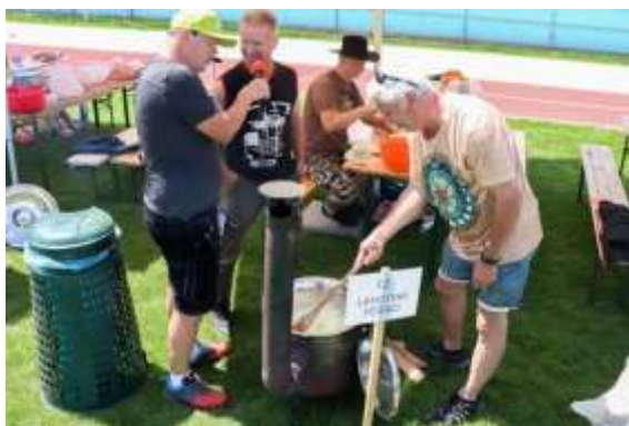
Obr. 96 - 3. miesto Lehotskí fešáci