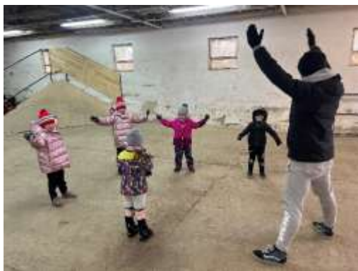
Obr. 130 – Halový tréning

Počas zimného obdobia 2023/2024 realizoval klub tréningy v halách. Cyklotrial trénovali v hale priamo v obci, pumptrack v Zbechoch a MTB v Topolčiankach. Tiež sa zúčastnili výjazdového tréningu v BMX hale v Šenkviaciach. Toto obdobie však skončilo a opäť sa cyklisti vrátili na vonkajšie športoviská do nášho areálu. V priebehu celého roka sa zúčastnili mnohých súťaží v rôznych miestach Slovenska, ale aj v zahraničí. Okrem tréningovej činnosti klub pripravoval aj podujatia, realizáciu otvorených projektov a zisťoval nové možnosti podania projektov.