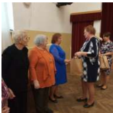
Obr. 120 - Výročná členská schôdza miestneho spolku

úradu rozdelili a rozdali ľuďom v obci. Aspoň takto mohli pomôcť tým, ktorí to najviac potrebujú a sú v zraniteľnej situácii.