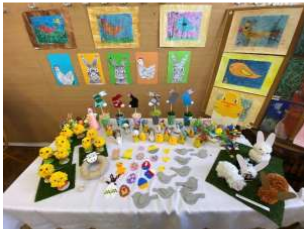
Obr. 73 – Veľkonočná výstava

V marci usporiadali v Spoločenskom dome veľkonočnú výstavu. Keďže sa výstava konala v čase prezidentských volieb, nepozývali predajcov veľkonočného tovaru. Výnimkou boli iba dve naše spoluobčianky, ktoré ponúkali veľkonočné medovníčky. Na organizácii výstavy úzko spolupracovali s materskou školou, základnou školou a do príprav sa aktívne zapojili aj členovia Jednoty dôchodcov a Záhradkári.