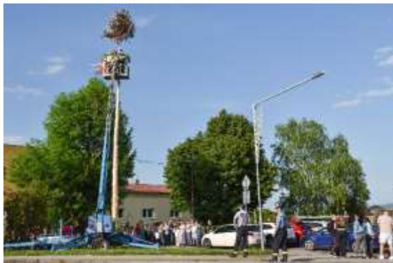
Obr. 90 – Stavanie mája