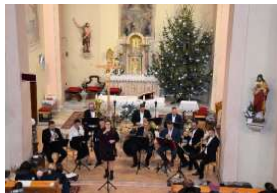
Obr. 109 – Trojkraľový koncert