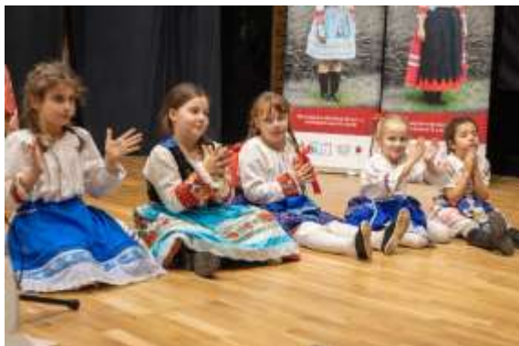
Obr. 124 – Folklorná skupina Drienočka