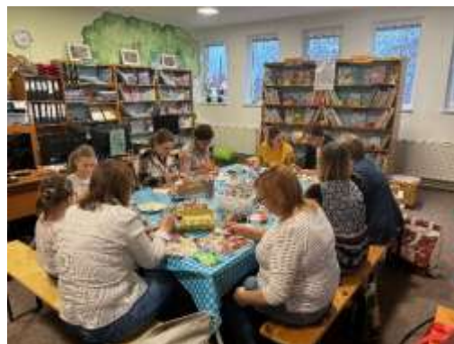
Obr. 59 – Tvorivé dielne pre dospelých